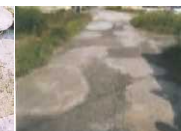
農道の窪みの補修