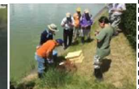
ため池の外來種駆除

実施主体：農業者等で構成される組織（①及び③は農業者のみで構成する組織でも取組可能） 対象農用地：農振農用地及び多面的機能の発揮の観点から都道府県知事が定める農用地