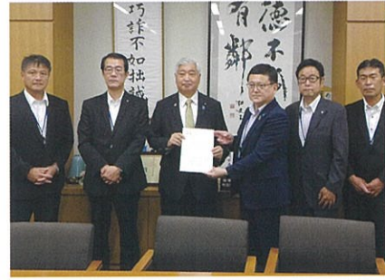
中谷 元 衆議院議員