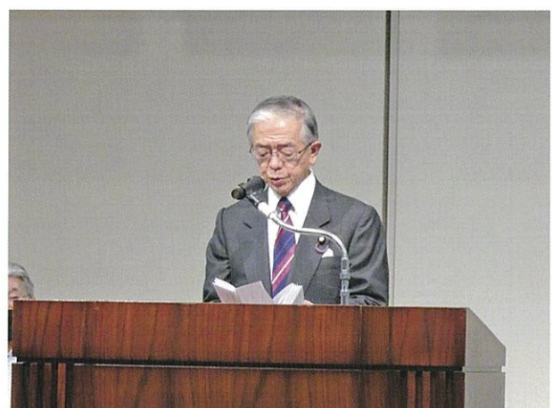
金子 原二郎 前農林水産大臣による祝辞