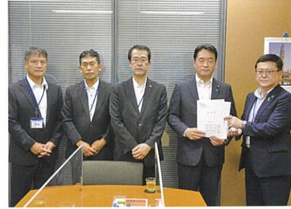
尾崎 正直 衆議院議員