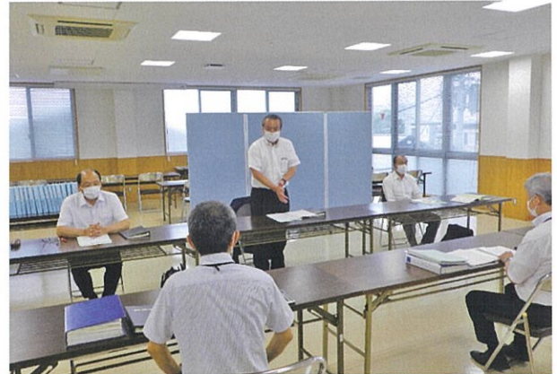
開会挨拶を述べる 楠瀬代表監事