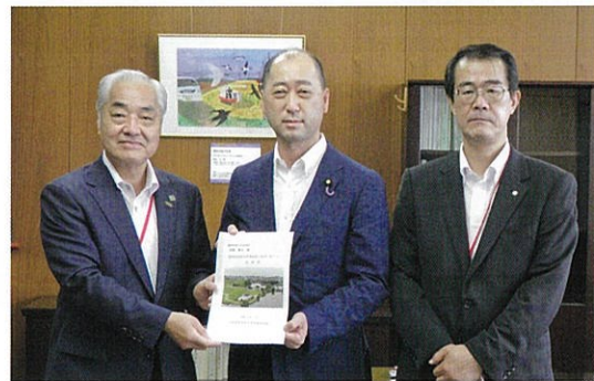
宮崎 雅夫 前農林水産大臣政務官