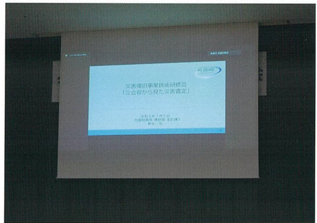
四国財務局 理財部 主計課 新名 弘 上席主計実地監査官 (web 講義)