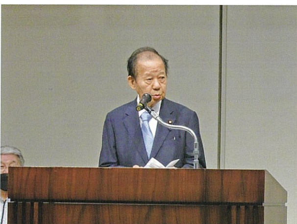
全国水土里ネット 二階 俊博会長による開会挨拶

集いでは、『土地改良事業の計画的・安定的な推進のため、現場のニーズに応えられるよう、必要な予算の確保』ほか9項目の要請案文が全会一致で採択され、元木 真澄やまがた水土里ネット女性の会会長をはじめ、男女5氏による力強い“ガンバロウ”の発声後盛大な拍手で応え、予算確保等要請の実現に向け氣勢を上げた。閉会后、各都道府県、水土里ネットの代表者が政府、国会議員などへ強力な要請活動を展開した。