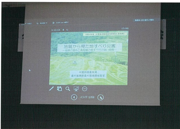
中国四国農政局 農村振興部 農村環境課 樺元 淳一 地質官 (web 講義)