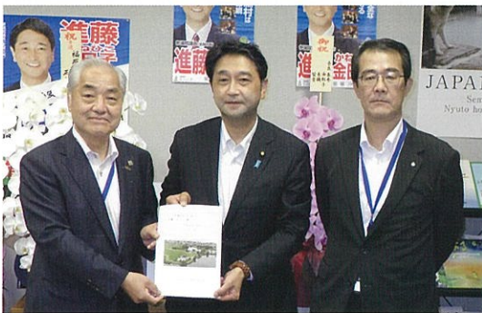
進藤 金日子 参議院議員