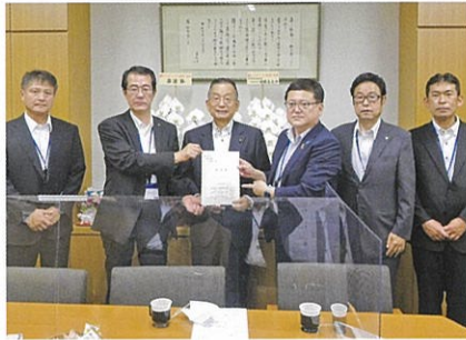
山本 有二 衆議院議員